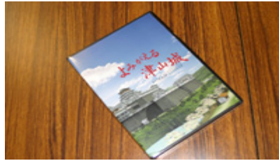
よみがえる津山城 DVD ¥2,000_ (送料 160_ 代引き送料 840_)