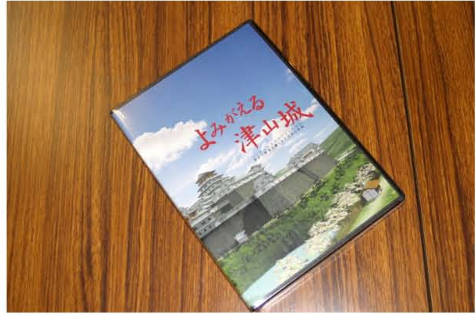
よみがえる津山城DVD 2000円 (送料160円 代引き送料840円)