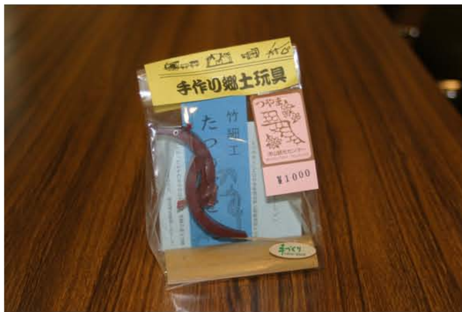
たつのおとしこ 1000円 (定形外郵便180円 代引き送料840円)