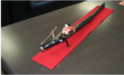
2012年の干支、竹の龍 大.. 5000_ 中.. 3500_ 小.. 2500_ (送料大・中: 290_ 小: 180_ 代引き送料 840_)