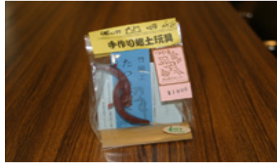
たつのおとしご ¥1,000_ (送料 180_ 代引き送料 840_)