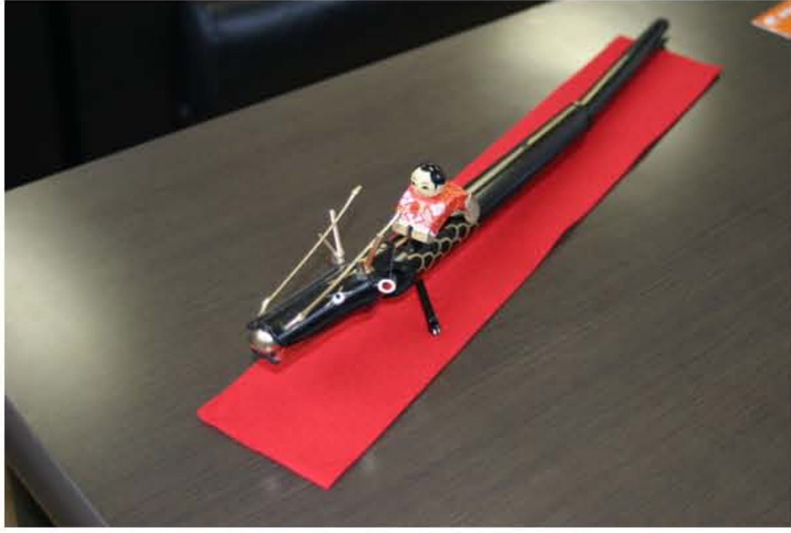
2012年の干支、竹の龍 大..5000円 中..3500円 小..2500円 (送料大・中：290円 小：180円 代引き送料840円)