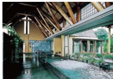
花美人の里 ☎0868-52-0788 花と木の町をイメージした外観で、館内もふんだんに使われた木材と花のすがすがしさにいっぱい。

奥津では昔から温泉を利用して「足踏みせんたく」が行われてきました。現在では観光用として奥津温泉独自の風物詩となっています。3日祝日の朝8時半から15分間