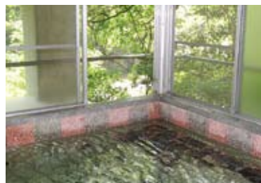
大釣温泉 ☎0868-52-0700 奥津温泉郷の中でも清涼の湯として知られる大釣温泉は、明治初期に発見されたアルカリ性単純泉でリウマチ、神経痛に反応している。